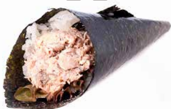
29. TONNO SOTT'OLIO € 3.00 (tonno cotto)