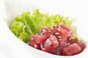
8. TARTARE TONNO