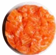
SALMONE FRESCO /MARINATO