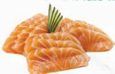
31. SASHIMI SALMONE 9PZ € 8.00