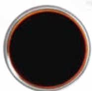
SALSA DI SOIA SENZA GLUTINE