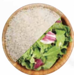
METÀ / METÀ