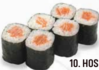
10. HOSO SAKE