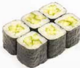
9. HOSO CETRIOLO