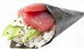
24. TUNA € 3.00 (tonno e avocado)