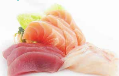
32. SASHIMI MISTO 12PZ € 10.00