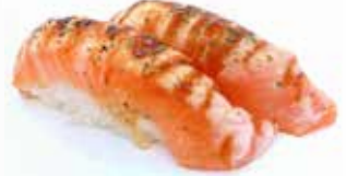
6. SALMONE SCOTTATO