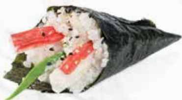
25. CALIFORNIA* € 3.00 (surimi, cetriolo, avocado e maionese)