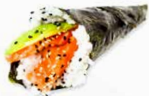
23. SAKE € 3.00 (salmone e avocado)