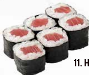
11. HOSO TONNO