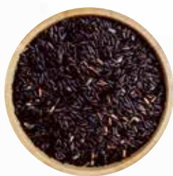
RISO VENERE (NERO)