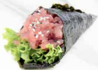
27. SPICY TUNA € 3.00 (tonno piccante)