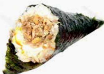
28. MIURA € 3.00 (salmone cotto e philadelphia)