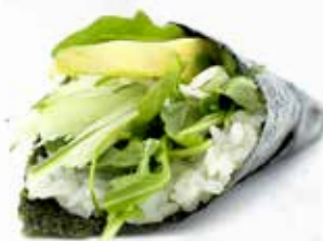
30. VEGETARIANO € 3.00 (insalata, avocado, cetriolo, maionese)