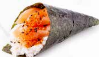
26. SPICY SALMON € 3.00 (salmone piccante)