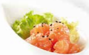
7. TARTARE SALMONE